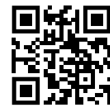
Visualiser la vidéo sur l'aménagement et l'équipement du nouveau métro

Maintenant qu'il est arrivé en gare, le tunnelier Laurence peut être démonté et évacué par convois exceptionnels, laissant ainsi la place aux équipes pour finir les derniers travaux de génie civil. En 2022, la gare de Fort – d'Issy – Vanves – Clamart entrera ainsi dans une nouvelle phase des travaux : celle de l'aménagement et de l'équipement.