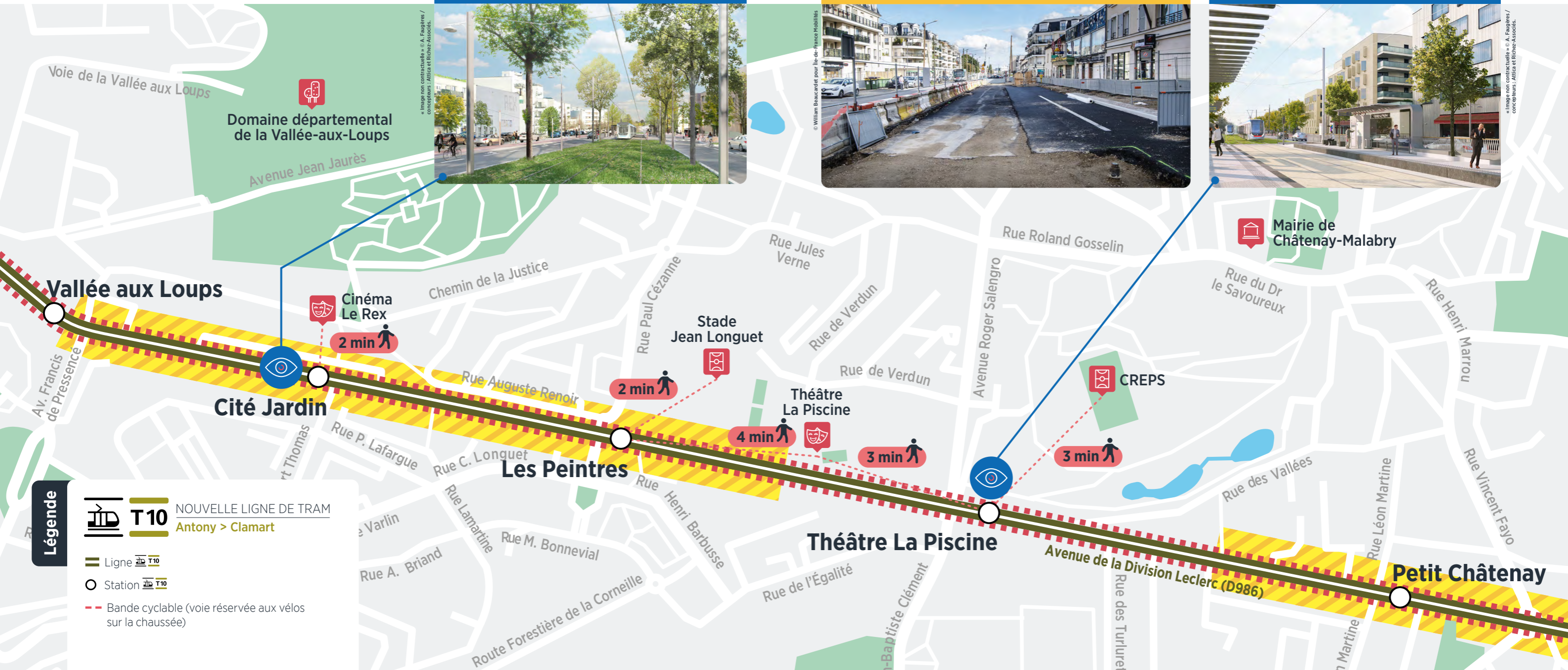
Images non contractuelles - © A. Paugères / concepteurs : Attica et Richiez-Associés.