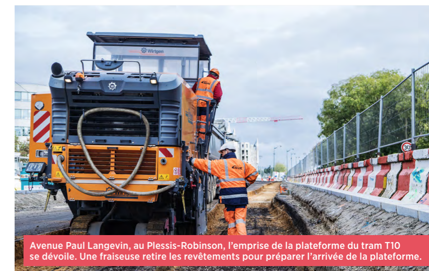
Avenue Paul Langevin, au Plessis-Robinson, l'emprise de la plateforme du tram T10 se dévoile. Une fraiseuse retire les revêtements pour préparer l'arrivée de la plateforme.

C onstruire une nouvelle ligne de tram et tous ses équipements associés en l'espace de 44 mois et ceci au cœur des 4 communes traversées, c'est le défi que les acteurs du tram T10 sont en train de relever.