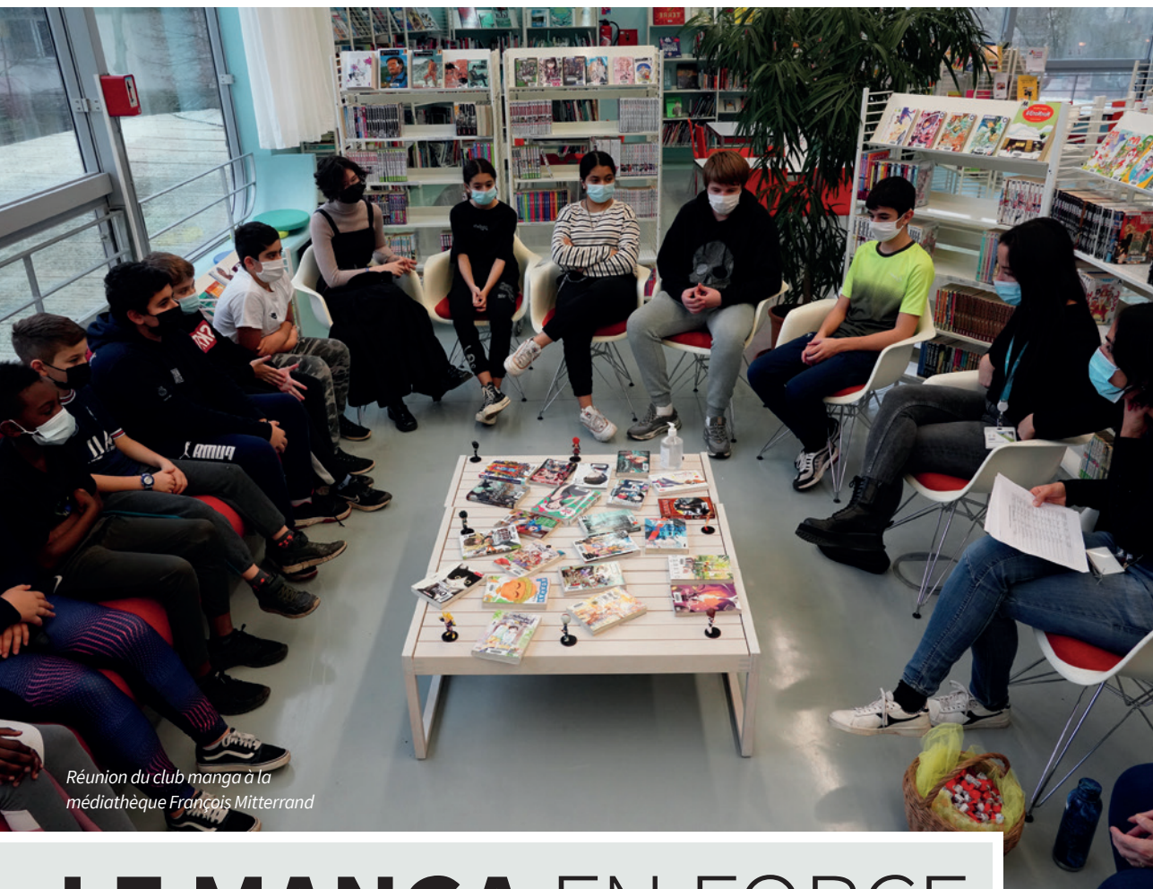
Réunion du club manga à la médiathèque François Mitterrand