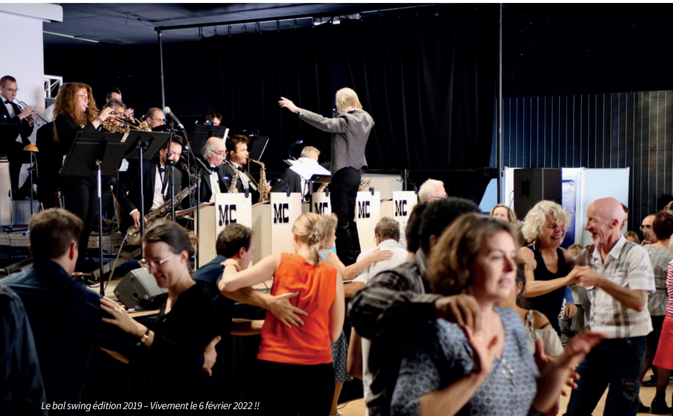
Le bal swing édition 2019 – Vivement le 6 février 2022 !!