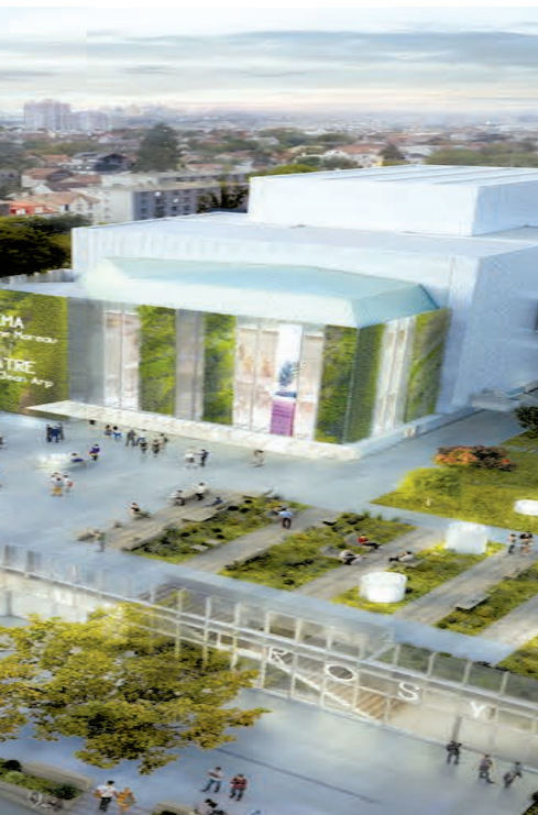
Le futur marché du Troisy.

11 millions d'€ seront investis en 2019 dans la rénovation du marché du Troisy.