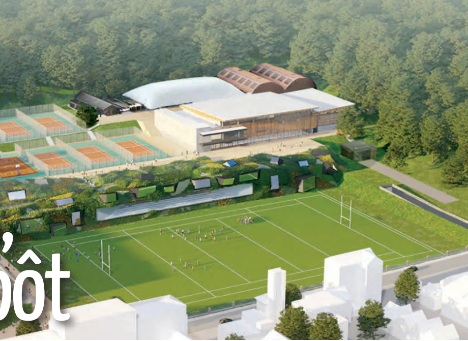
Le complexe sportif Hunebelle.