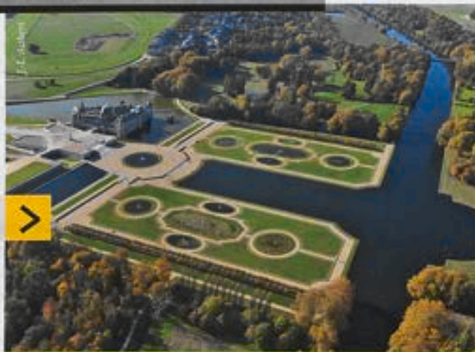
La journée du Maire se déroulera à Chantilly. PAGE 39