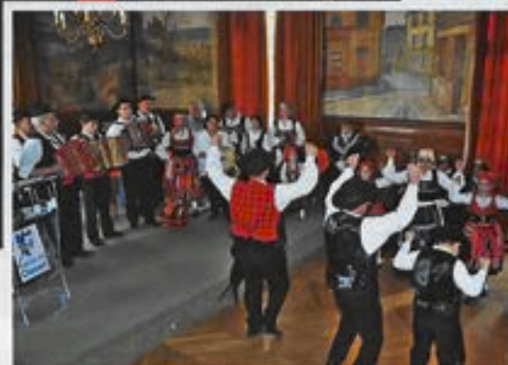
Le groupe folklorique Amizade e Sorrisos conduisait le défilé en musique et en couleur.