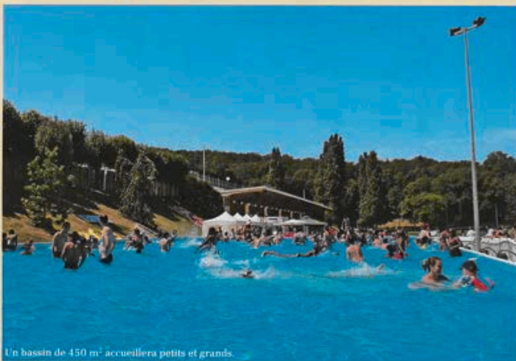
Un bassin de 450 m 2 accueillera petits et grands.

Le matin, le bassin est réservé aux centres de loisirs. L'après-midi, place