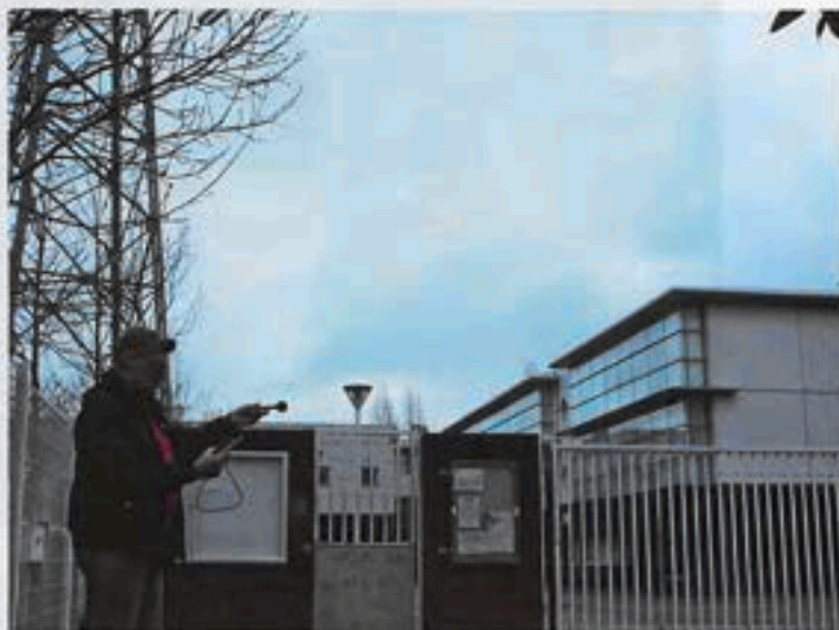
Les 22 et 23 février, la Ville a fait procéder à des mesures des champs magnétiques au dessus du collège des Petits Ponts.

Ces relevés sont inférieurs aux normes européennes en vigueur qui limitent l'exposition du public aux champs électromagnétiques ( 100\mu T ). Mais, deux études épidémiologiques (une étude suédoise datant de 1993 et une étude Franco-canadienne plus récente) ont conclu que les risques sanitaires augmenteraient à partir d'une exposition continue de 0.2 à 0.3\mu T .