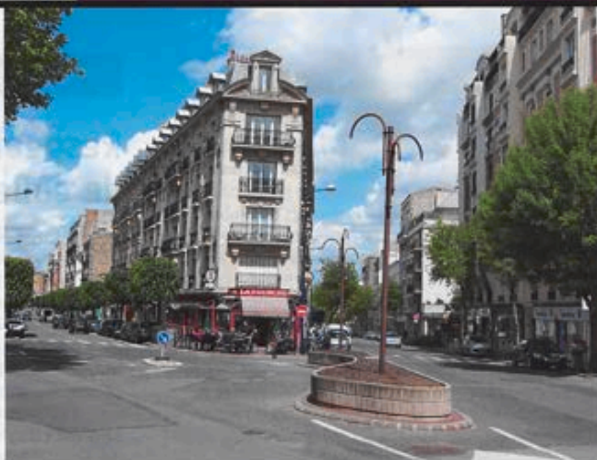
Les travaux du carrefour de la Fourche débutent le 14 juin.

et la pose d'un revêtement non phonique et plus écologique (dégageant moins de CO 2 ). Pour les automobilistes, une déviation sera mise en place. Elle se fera par la rue Hébert, la place de la Gare et l'avenue Jean Jaurès. Les bus de la RATP emprunteront quant à eux la rue de Fleury et l'avenue du Docteur Calmette. À partir du mois de septembre, les services du Département entreprendront la réfection des trottoirs, le marquage au sol (passages piétons) et la reprise des bateaux.