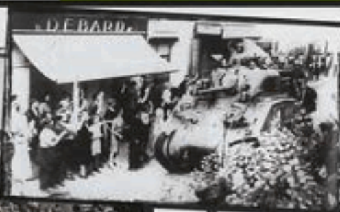
À l'arrivée des chars, la ville est en liesse rue Paul Vaillant Couturier.