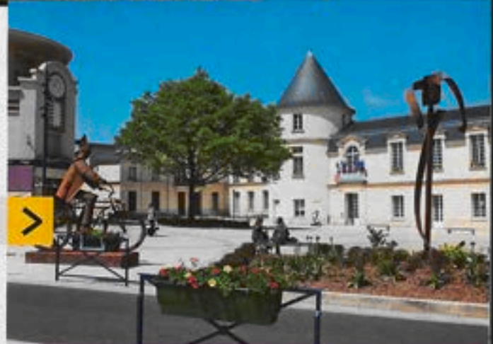
Début des travaux aux abords de la place de la Mairie. PAGE 24

Citoyenneté • Le conseil municipal du 14 avril • p.29