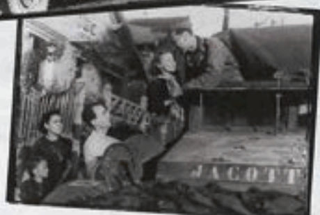
Rue du Plessis-Piquet (aujourd'hui rue de la Division Leclerc).