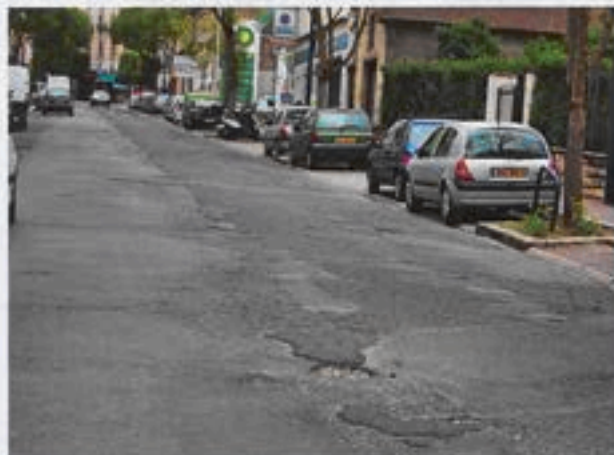
La rue de Vanves est en très mauvais état.

Promis depuis deux ans par le Conseil général, les travaux de réfection de la rue de Vanves interviendront le 14 juin et devraient durer quelques jours. Ils concerneront le rebouchage des nombreux trous sur la chaussée