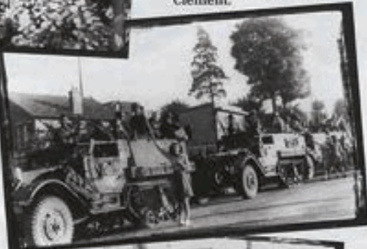
Sur l'avenue du Général de Gaulle, près de la descente vers l'avenue Jean-Baptiste Clément.