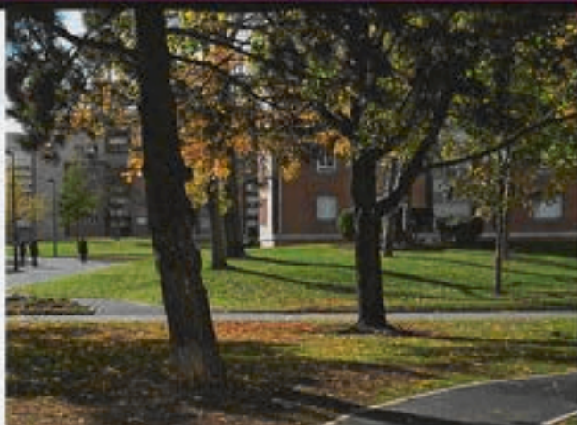
Les espaces extérieurs de la cité de la Plaine.

Mais parce que le foncier à Clamart est rare et cher, et que les besoins en logements à loyers modérés n'ont jamais été aussi importants (60 % des Clamartois ont des revenus leur permettant d'accéder au logement social), la municipalité a mis en place deux dispositifs. Lors de toute transaction immobilière, la Mairie peut faire valoir son droit de préemption (DIA) au profit de Clamart Habitat pour acheter des immeubles ou des terrains. Dans le même esprit, la règle d'affecter un minimum de 30 % de logements sociaux dans toutes les opérations immobilières de plus de 1 000 m 2