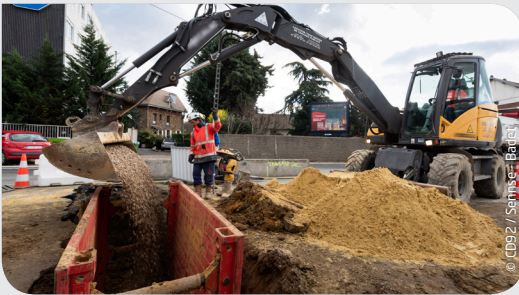
Réalisation de tranchées pour les réseaux d'assainissement