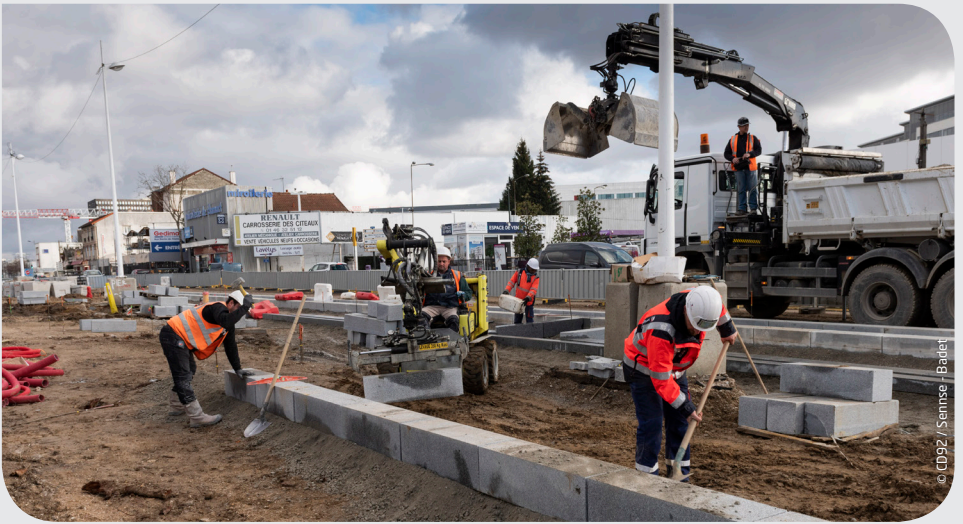
Pose des bordures granit