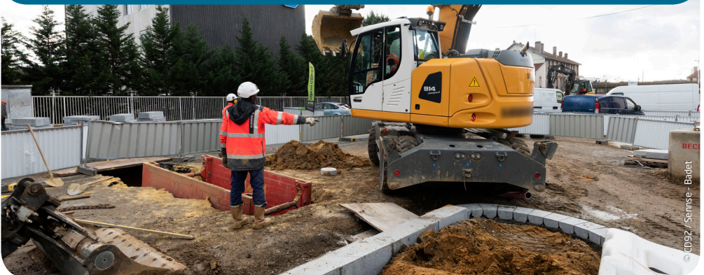
Réalisation de tranchées pour les réseaux d'assainissement

Le travail d'équipe, le sens de l'organisation, l'anticipation des aléas et les relations humaines sont des aspects majeurs. C'est un travail concret et stimulant par son enjeu principal qui est de créer le meilleur cadre de vie possible, en préservant également l'environnement.