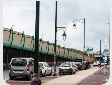
Rue du Général Eisenhower