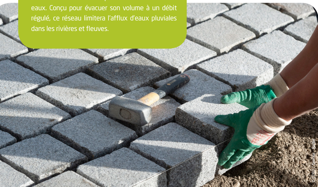
Pose des pavés granit