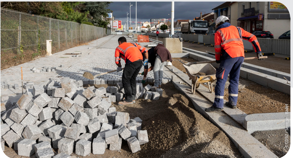
Contre-allée de l'avenue du Général de Gaulle