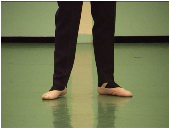
Lorraine Féline, Martita , 2007 Film couleur, sonore, durée 9'40 Image extraite du film © Lorraine Féline