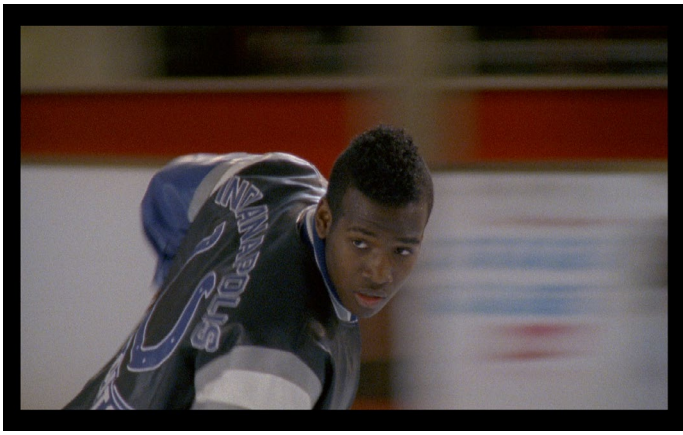
Antoine Danis, Traversées , 2013 Film, couleur, sonore, durée 8'17, distribution Grec Image extraite du film © Antoine Danis, Grec