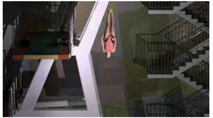
Axel Danielson & Maximilien Van Aertryck, Hopptornet (Ten Meter Tower) , 2016 Film couleur sonore, suédois sous-titré en français, durée 16'18 Image extraite du film