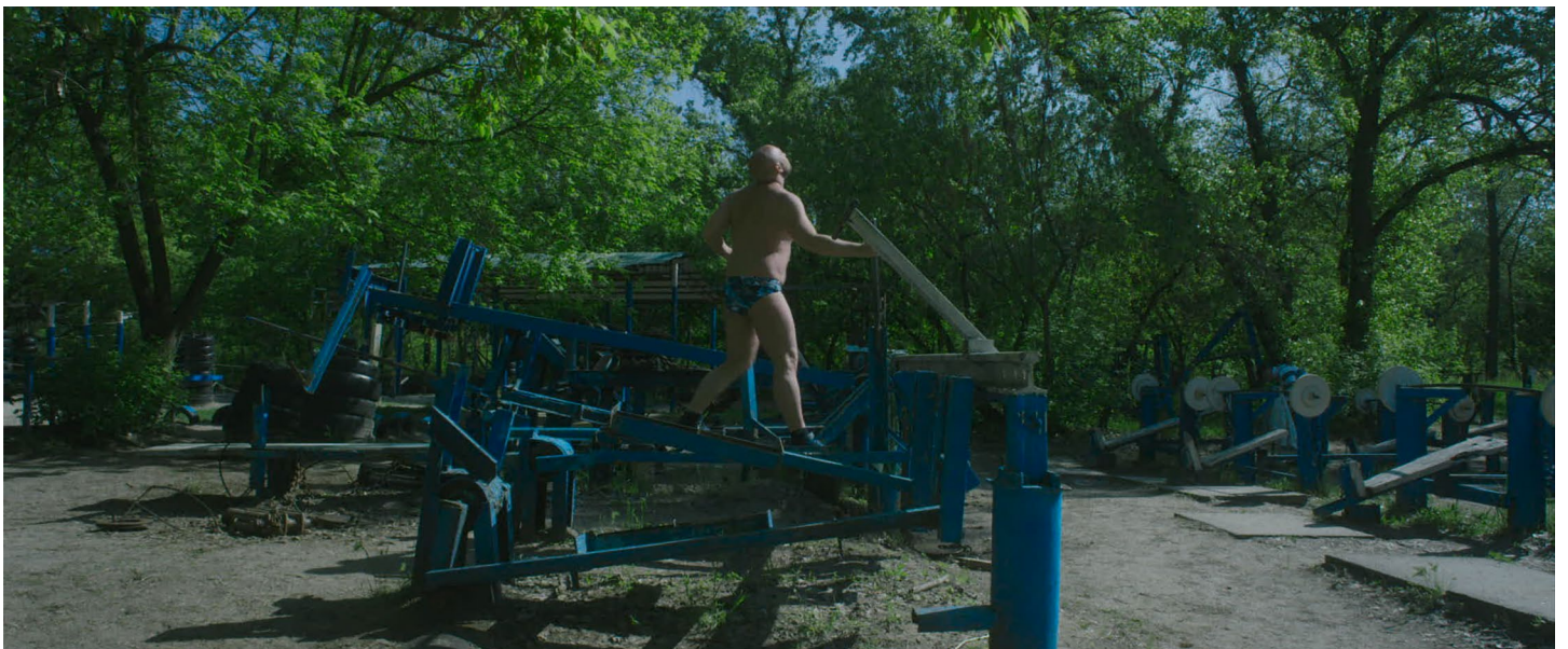
Gar O'Rourke, Kachalka , 2019 Film documentaire, couleur, sonore, ukrainien sous-titré en français, durée 9'20 Image extraite du film