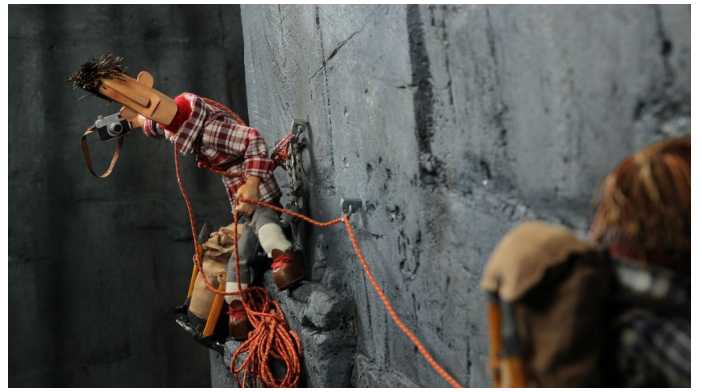
Ignasi López Fábregas, Viacruxis , 2018 Film d'animation, couleur, sonore, durée 11' Image extraite du film