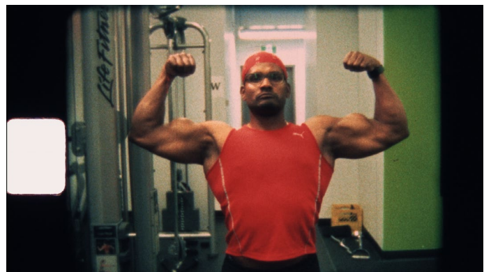
Ian Bawa, Strong Son , 2020 Film super8, couleur, sonore, durée 4' Image extraite du film