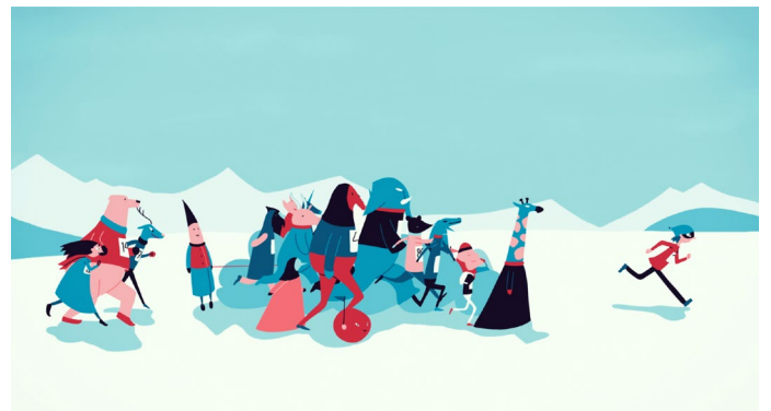
Hanne Berkaak, Le jour du marathon , 2015 Film d'animation, couleur, sonore, durée 7'30, distribution Agence du court-métrage Image extraite du film