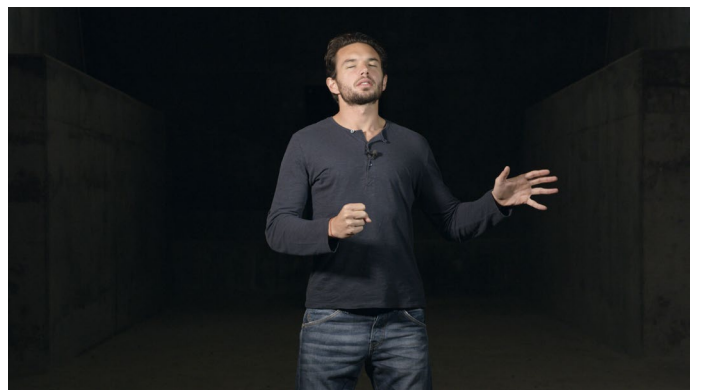
Camille Llobet, Faire la musique , 2017 Vidéo 4K, couleur, son stéréo, durée 15'27 Image extraite du film