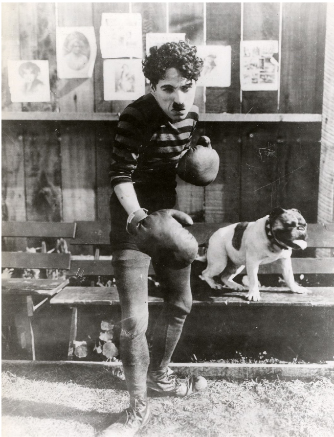
Charlie Chaplin, The Champion - Charlot Boxeur , 1915. Film noir et blanc, muet sonorisé, durée 29'39, distribution Lobster Films Image extraite du film