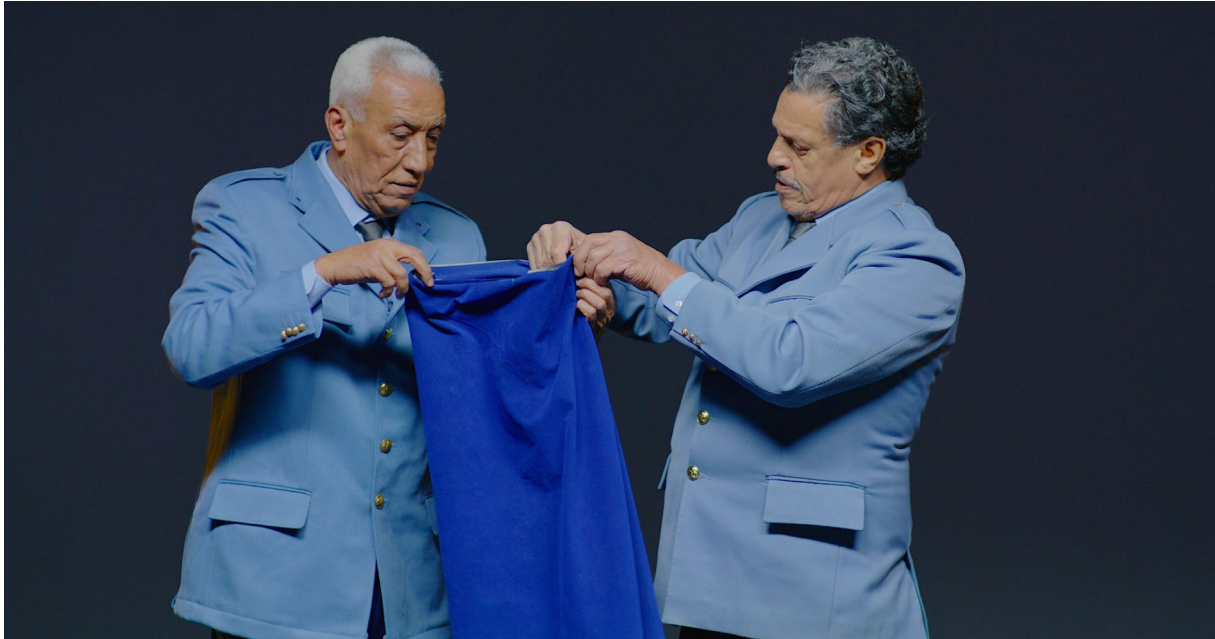
Les plieurs, 2021 Co-produit par le CACC – Clamart