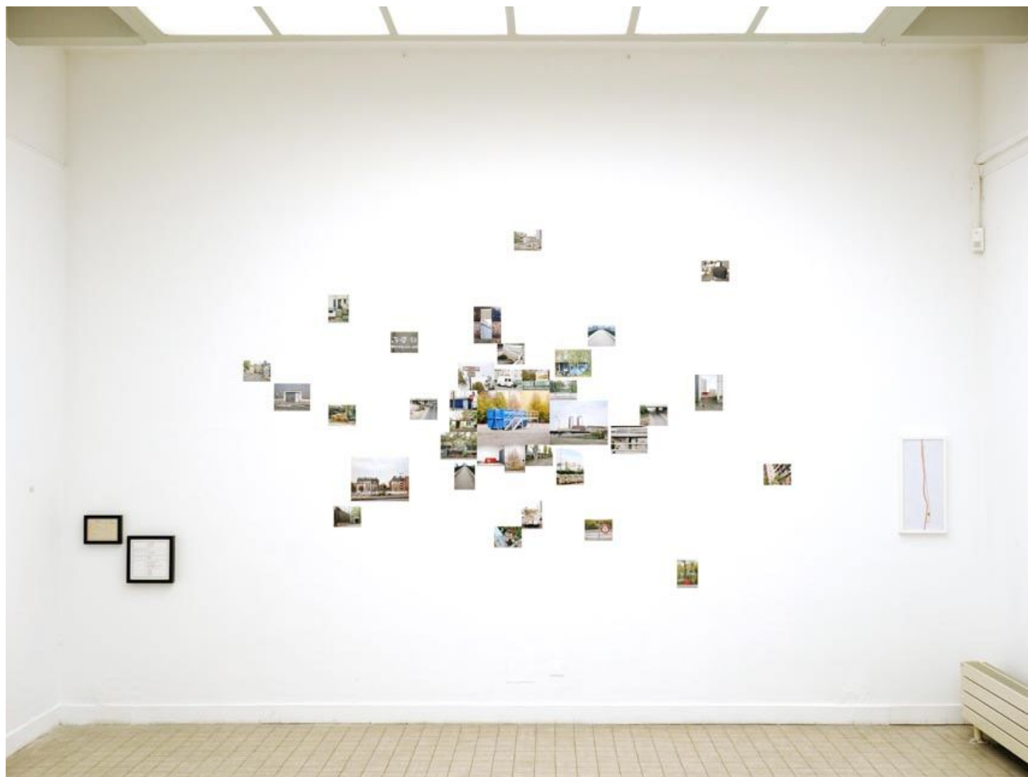
PARIS PÉRIPH #04 - Exposition Hors Limites - Centre d'Art A. Chanot de Clamart - Septembre 2013