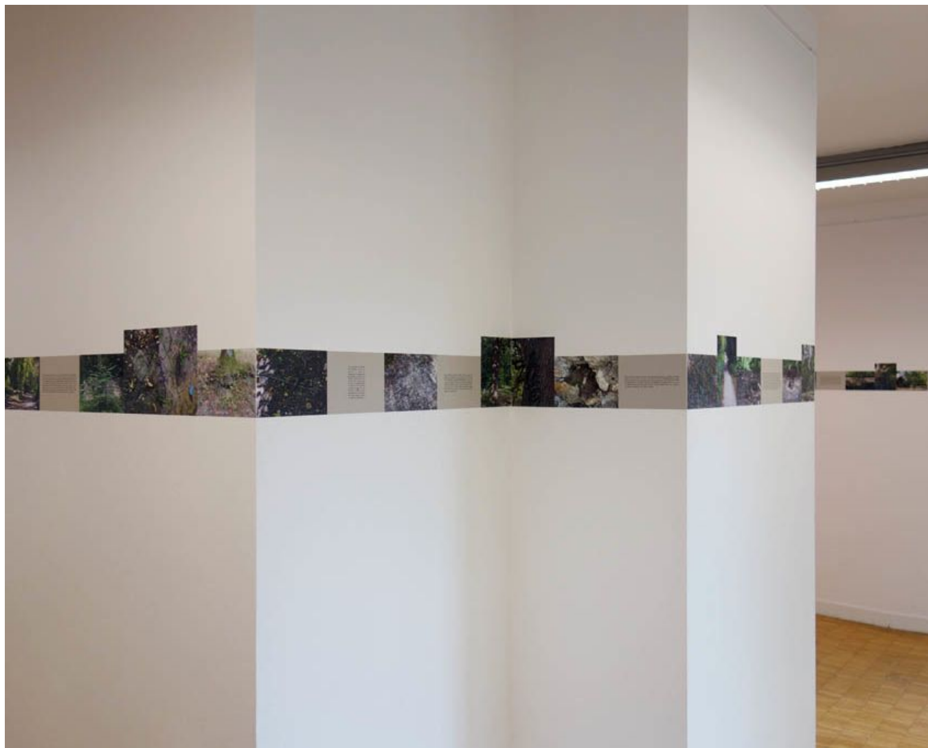
Exposition DU CÔTÉ DU BOIS - La Buanderie, Clamart - Novembre 2012

Du côté du bois conte le destin historique de trois monuments peu connus de la commune de Clamart.