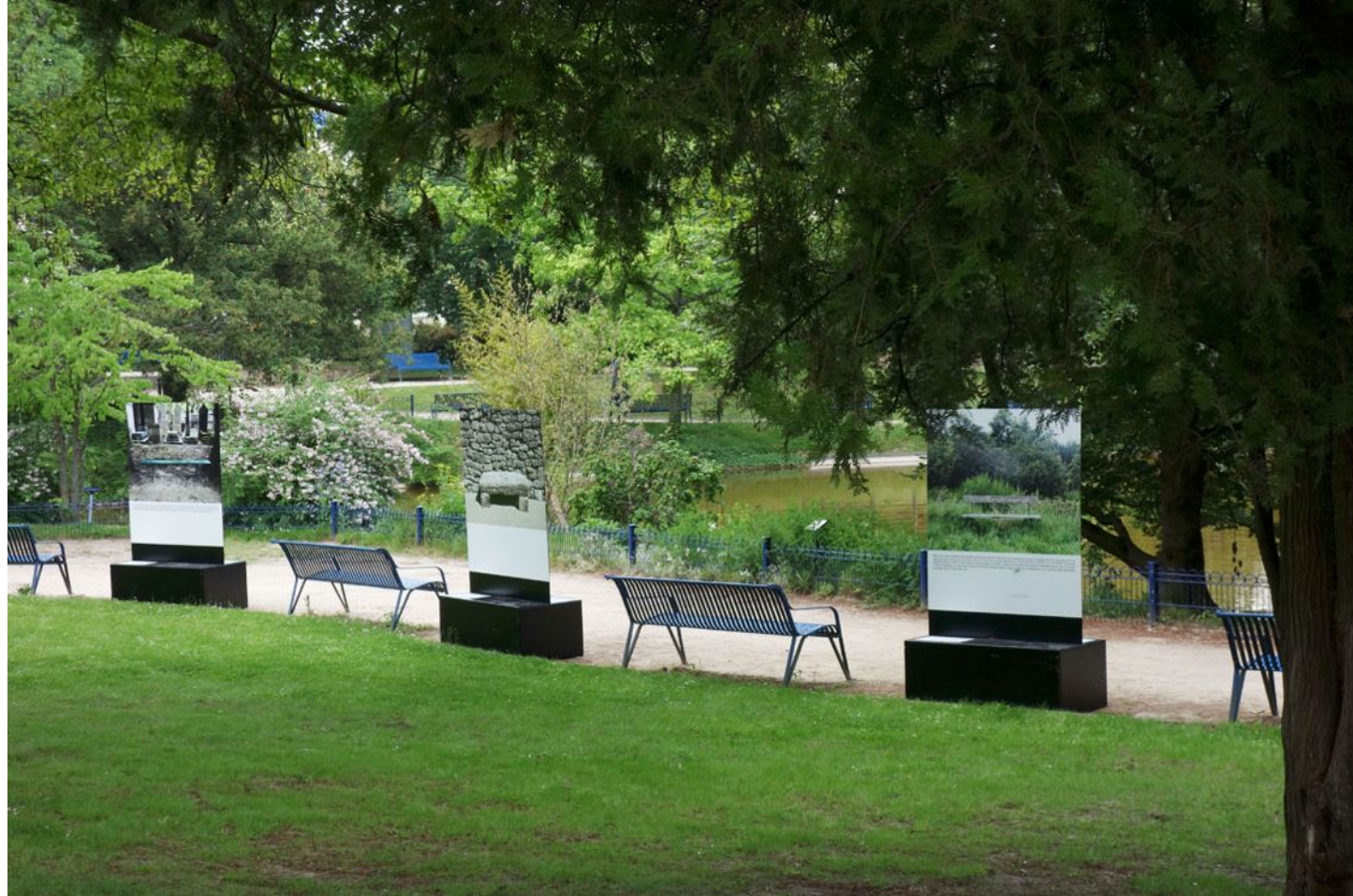
CES BANCS-LÀ – Exposition Parc Maison Blanche - CACC de Clamart [Hors les murs] - Juin 2018