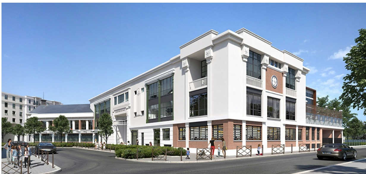
Perspective de l'école primaire - ©Agence Marc Farcy Architecte

Plaine Sud - Juin 2021 ©Eiffage Construction