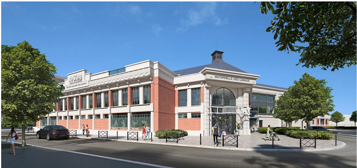
Perspective de l'école maternelle - ©Agence Marc Farcy Architecte

Il sera en outre un lieu de vie pour le quartier avec des activités sportives et culturelles ouvertes à tous.