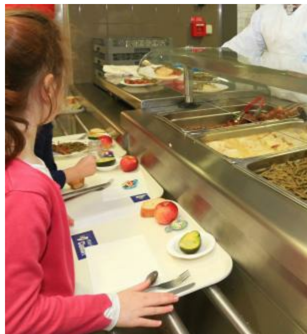
ENFANCE, PETITE ENFANCE, AÎNÉS Restauration municipale : les menus de la semaine du 23 au 27 mai