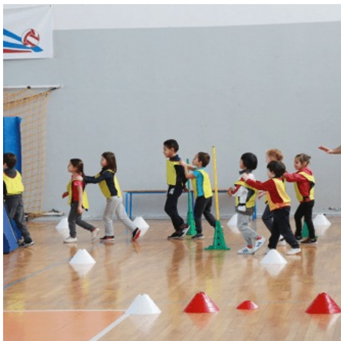
SPORT, ENFANCE, JEUNESSE École Municipale des Sports (EMS) - Stage pendant les vacances d'été